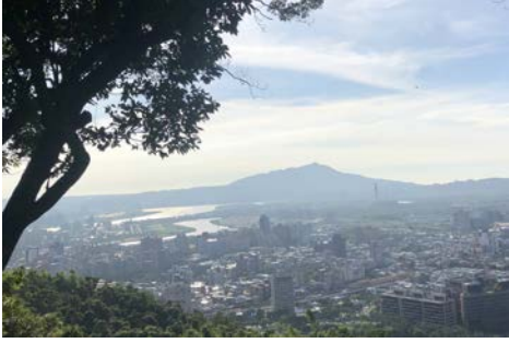
(步道途中往北遠眺大屯群峰)

「小百岳」乃行政院體育委員會為了推動全民登山運動，在普及性考量下，以各縣市近郊山區為標的，甄選出一百座較具特色或具代表性的「郊山」，因海拔不高，離市區又近，又有許多路徑標示可供辨識，人人可輕易攀登