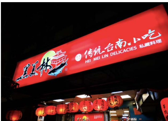
(晚餐在黑美林擔仔麵)

那天安排我們坐在 K16、K17、K18 三桌，點了 13 道菜，可惜沒拍照下來，看看菜單回味一下吧！招牌鵝肉、滷味拼盤、白蝦干貝米粉鍋、清蒸海魚、香蒜牛排、蒜頭蝦、特製香腸、脆皮烤腸、野生海瓜子、菜圃蛋、綠竹筍肉絲、海鮮豆腐、新鮮時蔬。當晚伴隨著 20 多瓶十八天台啤，氣氛很嗨！度過了很愉快的夜晚。