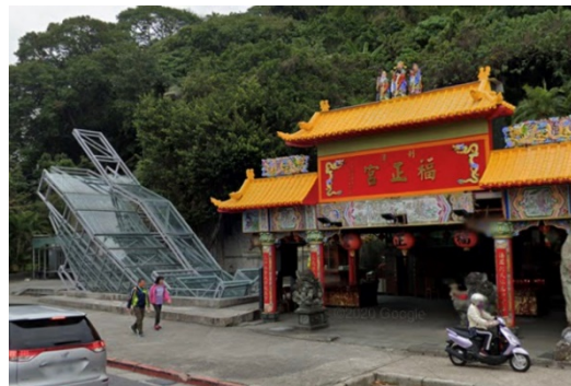
(集合地點：劍潭站福正宮)