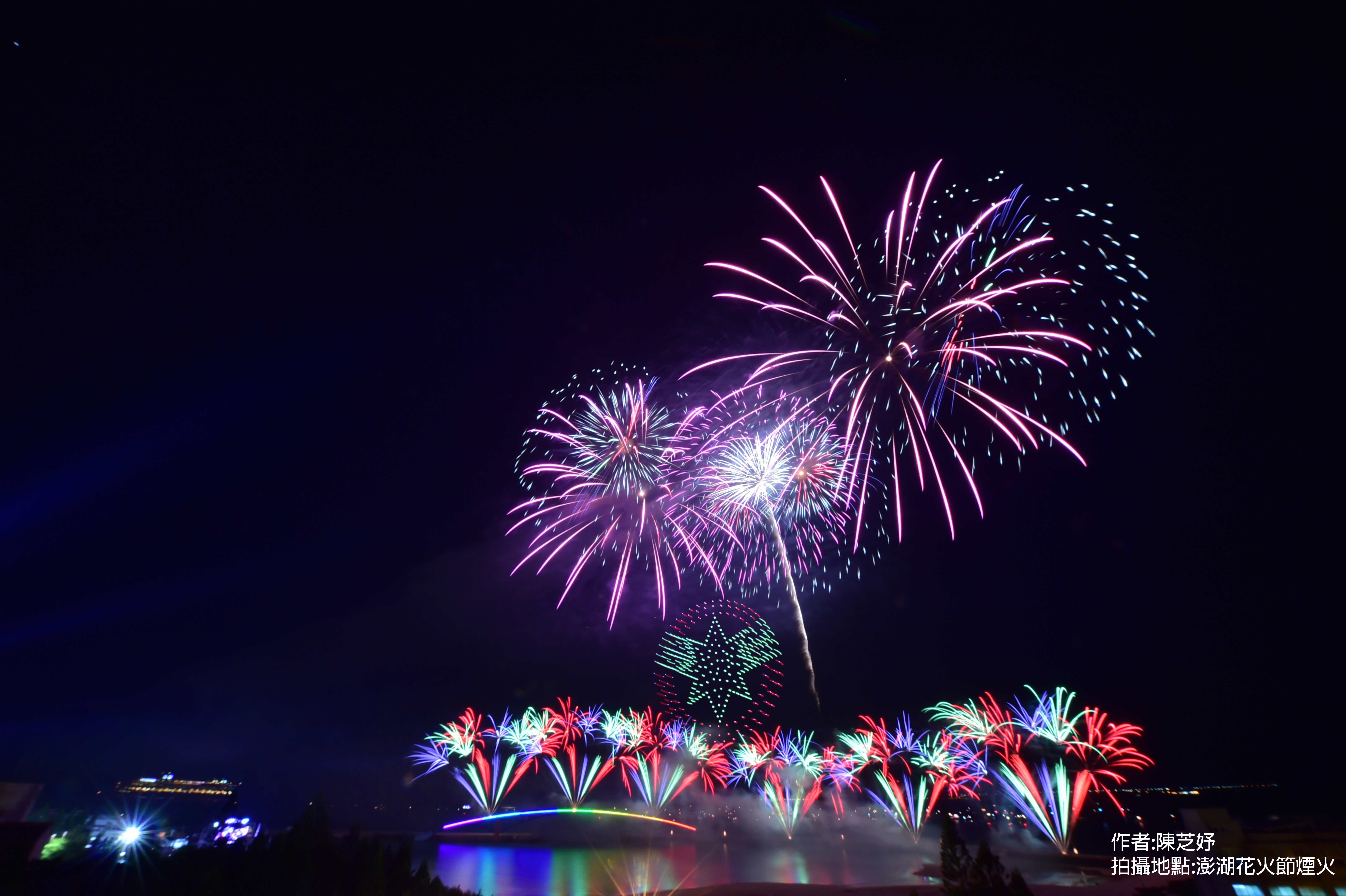
作者:陳芝好 拍攝地點:澎湖花火節煙火