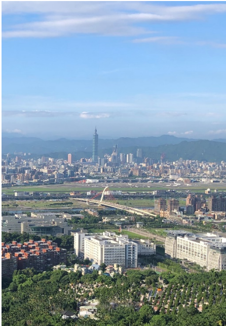
(老地方觀景平台與 101 遙遙相對)

台北市政府於 2007 年設置了劍潭山親山步道，西起中山北路四段劍潭公園、福正宮旁的登山口，交通相當便捷；步道沿途綠意盎然、樹蔭清涼，加之夏日微風吹佛，走起來真是輕鬆自在，此步道已是台北市民晨間運動的熱門場所；而幾處觀景點視野甚佳，可遠眺大屯山群峰雄偉、觀音山日落美景，稜線上知名的「老地方觀景平台」更可俯視台北繁華市區，與 101 大樓南北相望；沿著山陵續行亦可抵達大直、內湖和外雙溪、陽明山等地，本次行程即安排從西邊劍潭公園登山口出發、途經老地方觀景平台、往東續行經過自強隧道上方、再銜接劍南路、抵達「劍南蝶園」後下行至大直捷運劍南路站，再搭乘一站捷運至附近的黑美林擔仔麵晚餐；合計全程距離約 5.5 公里、上下高度落差 140 公尺、不含休息大約步行兩小時左右，對於皆是中年以上的社友們而言，此行程還頗富運動量。