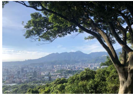
(觀音夕照美景，可惜場勘時間早了點！)