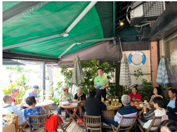
城中大業屏東兄弟社三角結盟例會&活動由大業社舉辦於北港朝天宮